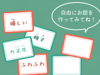
お題カード 80枚 (お題あり76枚/空欄4枚) ※お題の傾向 赤:抽象的/緑:具体的